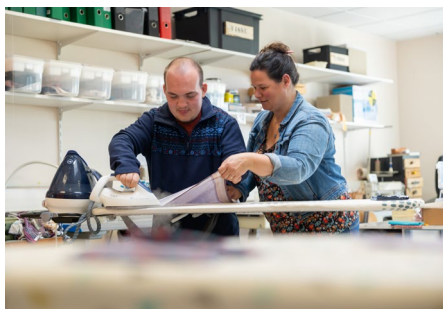
Un jeune du DIME Europe lors d'un atelier préprofessionnel