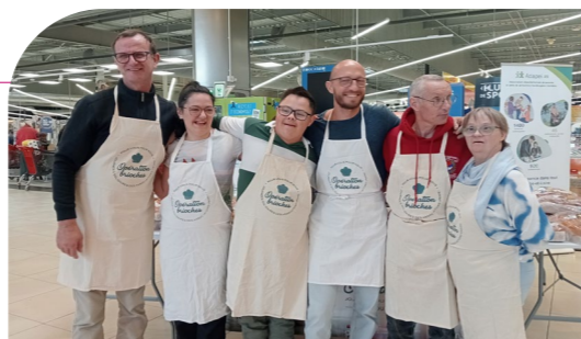
Vente de brioches au Carrefour Market de Distré

Les jeunes de l'IME Chantemerle ont fait une vente durant 2 heures à la boulangerie Les Tuffeaux de Bagnaux accompagnés de 2 parents bénévoles. Avec notre partenaire Carrefour Market de Distré, nous avons aussi fait une vente publique. Parents, enfants et adultes accompagnés des foyers L'Accueil, La Maison des Pins et de l'habitat inclusif de Saumur, sont devenus des vendeurs le temps d'une journée !