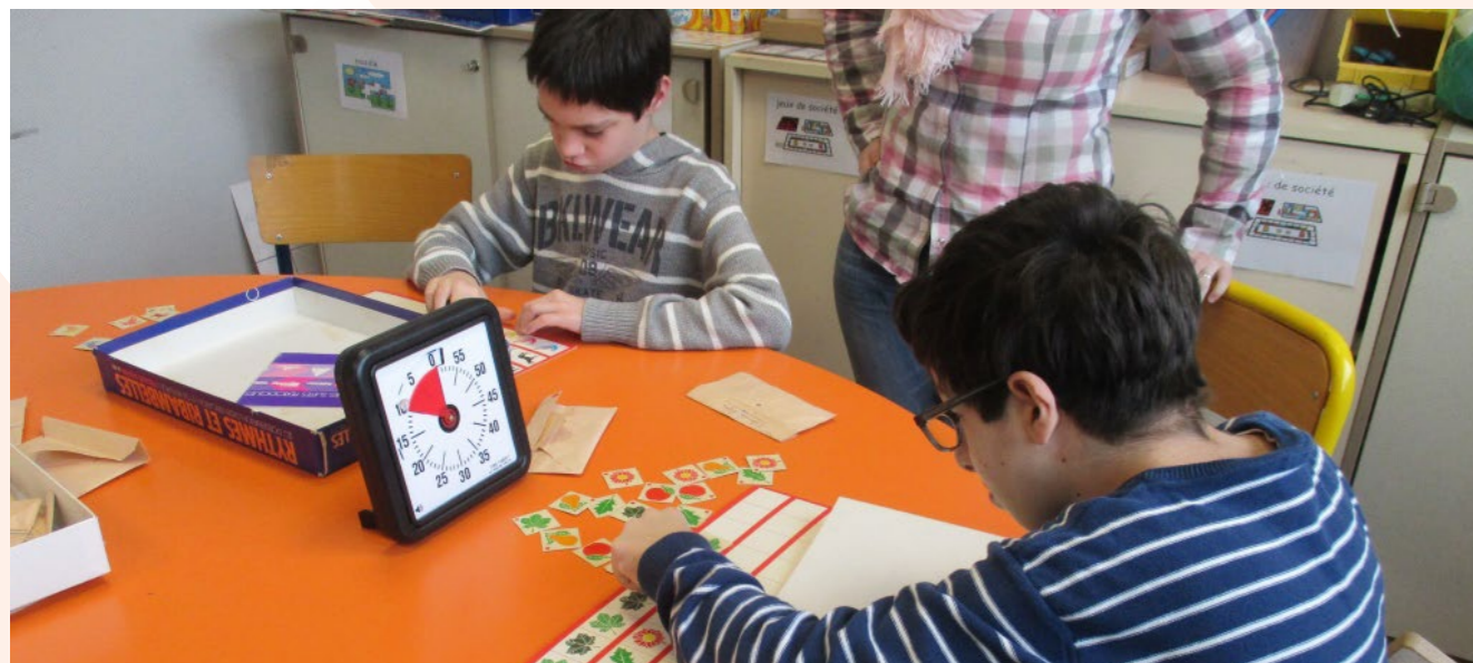
2 jeunes de l'IME Chantemerle lors d'une activité

L'IME CHANTEMERLE GUIDE LES JEUNES VERS UN AVENIR PROMETTEUR