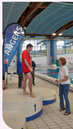
Un Escalien remporte une médaille en natation