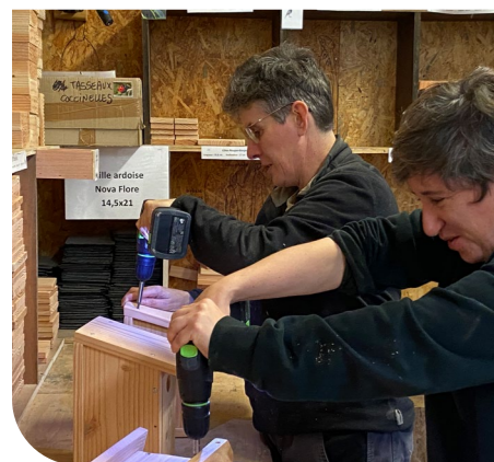
Des nichoirs en construction