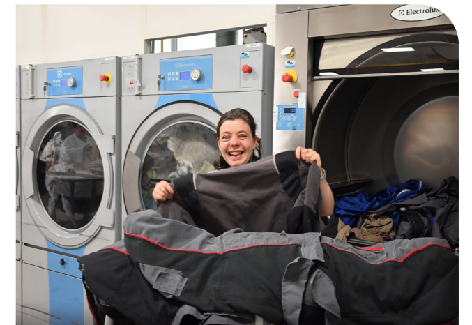
Une salariée de la blanchisserie d'Odéa EA de La Pommeraye à Mauges-sur-Loire

Le sourire de nos ouvriers en dit long sur leur satisfaction au travail. Odéa, le groupement d'entreprises adaptées de l'Adapei 49, est bien plus qu'une simple entreprise. C'est un lieu où les personnes en situation de handicap peuvent s'épanouir, développer leurs compétences et vivre une expérience professionnelle enrichissante.